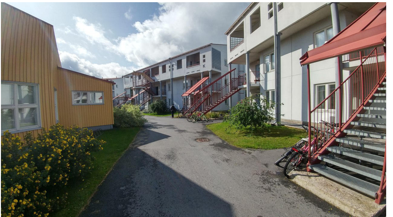
На фото – кампус.